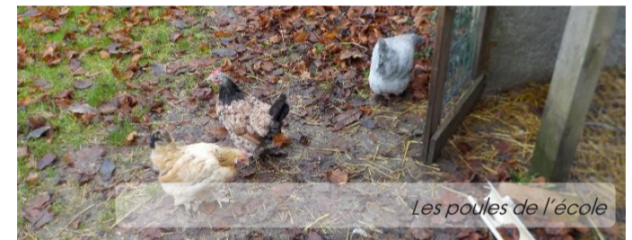
Les poules de l'école

Les poules de l'école s'appellent Grisetle, Nocturne et Roussette. Elles vivent dans un poulailler, dans le jardin de l'école. Elles mangent des graines et du pain. Elles pondent des œufs et on marque la date dessus puis on les range dans le frigo.