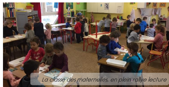
La classe des maternelles, en plein rallye lecture

L'après-midi pendant la sieste on a calculé les points de chaque équipe et ensuite on a fait le classement.