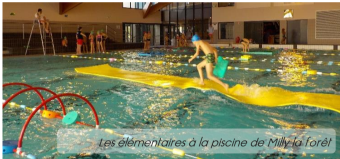
Les élémentaires à la piscine de Milly la forêt