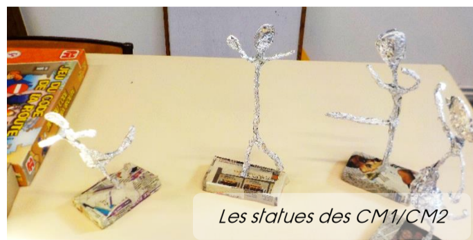
Les statues des CM1/CM2