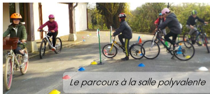
Le parcours à la salle polyvalente

Avec la classe, tous les vendredis, nous apportons chacun notre vélo. Nous installons trois ateliers :