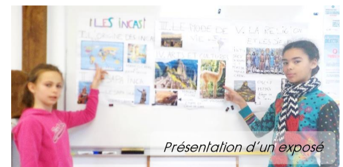
Présentation d'un exposé