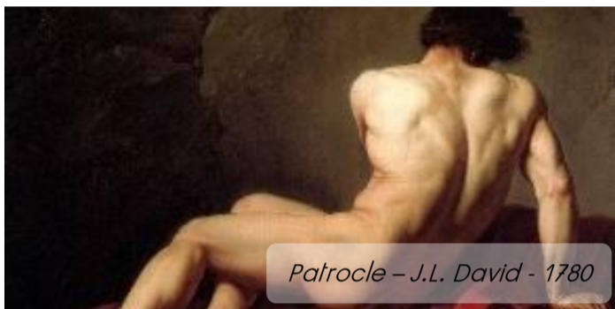
Patrocle - J.L. David - 1780