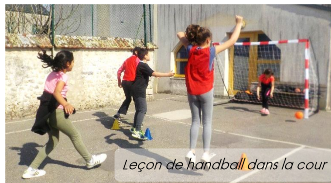
Leçon de handball dans la cour