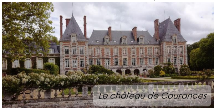
Le château de Courances