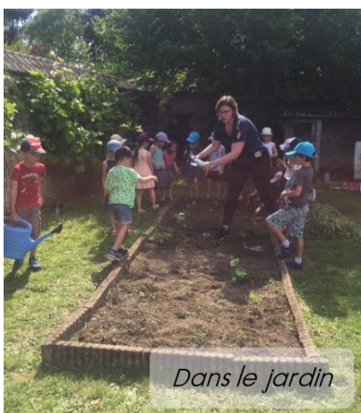
Dans le jardin

On a planté des graines de potimarron, de tomate et de concombre dans des petits pots.