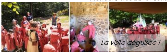
La visite déguisée !