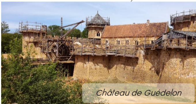
Château de Guédelon