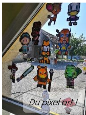
Du pixel art !

Tous les vendredis, on fait du pixel art. Un pixel art c'est un personnage qu'on doit reproduire sur un quadrillage puis on le repasse au feutre. Il y a des petits et des gros pixels art. Il y a des pixels art Disney, Harry Potter et Star Wars. On peut faire quatre pixels art et quand ils sont finis, on les colle à la fenêtre. Les enfants de la récréation regardent nos pixels art.