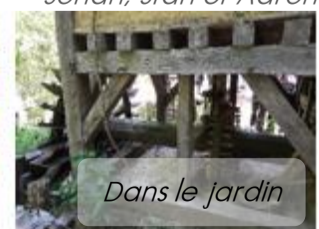
Dans le jardin